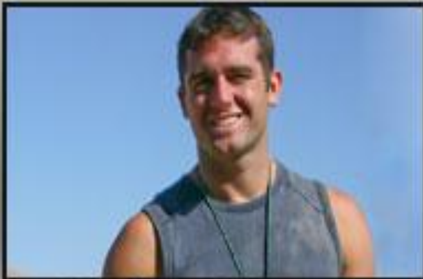
Medium Close up