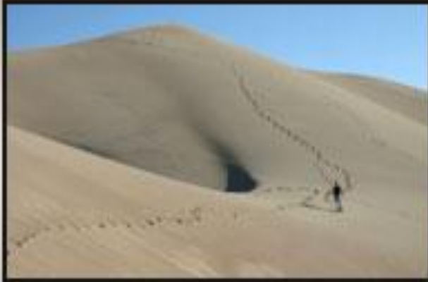
Extreme Wide Shot