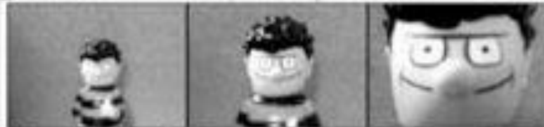
Zoom Out [lens]